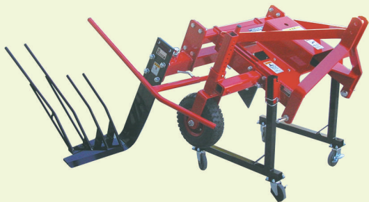
他の作物も対応可能です