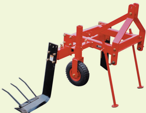
他の作物も対応可能です