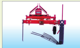
収納装置(オプション)