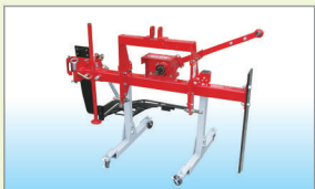
キャストースタンド(オプション)