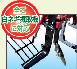
フロントディスク(オプション)