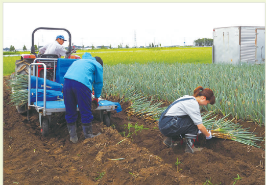
多人数作業の場合