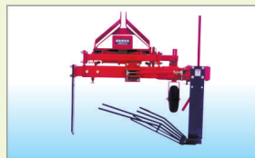
収納装置(オプション)