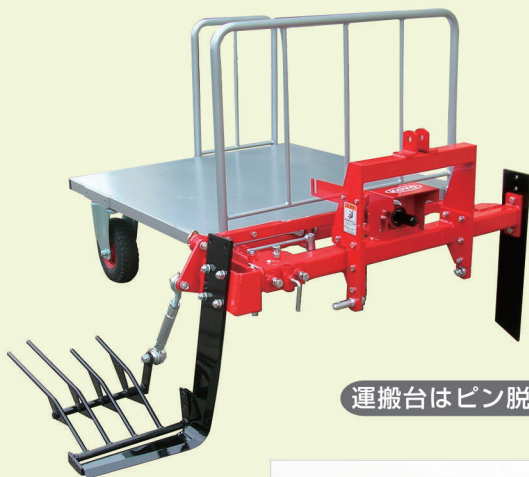
運搬台はピン脱着できます