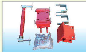
収納装置(オプション)