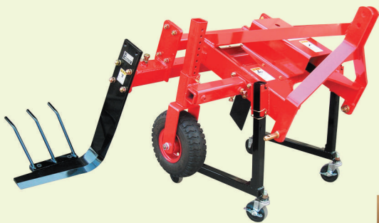
他の作物も対応可能です