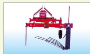
収納装置(オプション)