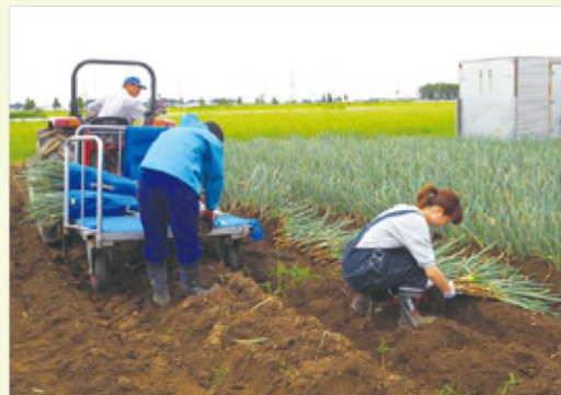
多人数作業の場合