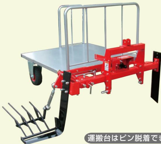
運搬台はピン脱着できます