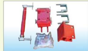
収納装置(オプション)