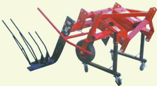
他の作物も対応可能です