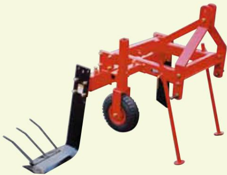
他の作物も対応可能です