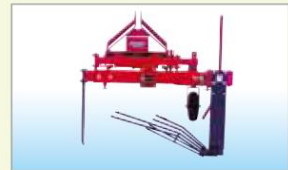
収納装置(オプション)