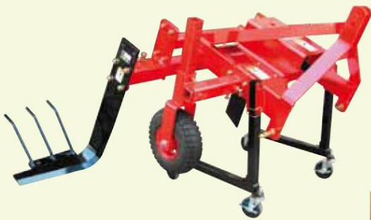
他の作物も対応可能です