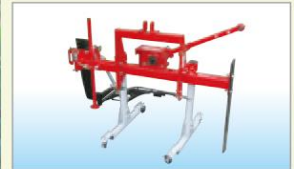
キャスタースタンド(オプション)