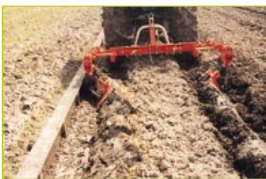
本体左 (I 型・II 型)